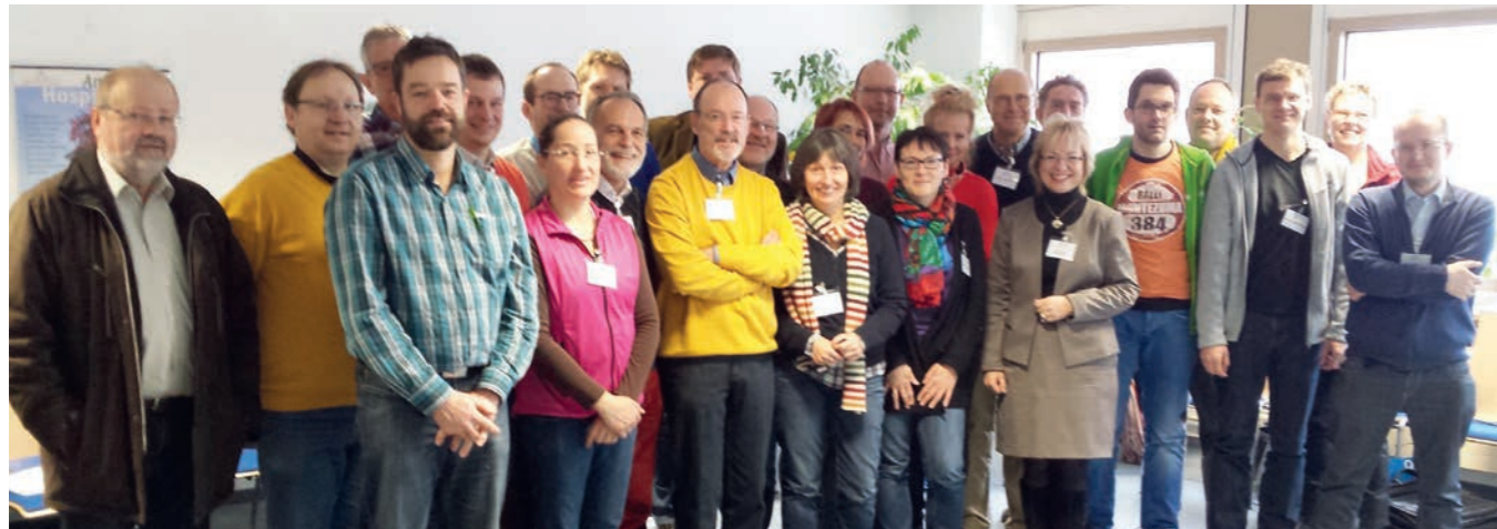
Zufriedene Teilnehmer des Pilotkurses „Kursweiterbildung Palliativmedizin AAPV“

Für Medizinischen Fachangestellte (MFA) wurde 2016 erstmals die Fortbildung zur Betriebswirtschaftlichen Assistentin in der Hausarztpraxis, kurz BEAH® angeboten. Das speziell auf die Hausarztpraxis abgestimmte und bislang bundes-