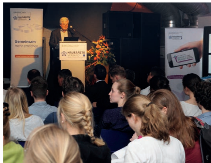
Beim Nachwuchstag 2016 war der Saal im Erlanger E-Werk bis auf den letzten Platz besetzt.

Eine berufspolitische Dimension hat auch der Nachwuchstag , den der Bayerische Hausärzterverband am 21.04.2016 unter der Schirmherrschaft der Bayerischen Gesundheitsministerin Melanie Huml in Kooperation mit der Medizinischen Fakultät der Friedrich-Alexander-Universität (FAU) und mit Unterstützung der Techniker Krankenkasse in Erlangen ausrichtete. Berufsverband, Politik, Lehre und Krankenkasse ziehen an einem Strang, um eine der größten Herausforderungen im heutigen Gesundheitswesen zu bewältigen: Mehr angehende